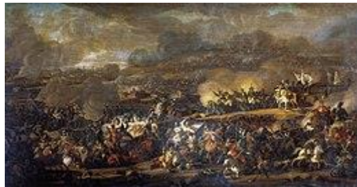
Slag bij Leipzig door Vladimir Moshkov ; geschilderd in 1815

Napoleon organiseerde zijn troepen rond Leipzig om zijn bevoorradingslijnen te verdedigen en de geallieerden te weerstaan. Napoleon concentreerde zijn troepen op een lijn van Taucha tot Stötteritz , waar hij zijn commandopost plaatste, die daarna in zuidwestelijke richting wendde naar Lindenau . Het Oostenrijks-Pruisisch-Russische leger van Bohemen trok op vanuit Dresden en de Pruisisch-Russisch-Zweedse legers van het Noorden en Silezië vanuit het noorden. In het totaal hadden de Fransen ongeveer 190.000 troepen, de geallieerden 200.000 op de 16e, maar dat aantal zou groeien tot 330.000. Beide kampen hadden veel zware artillerie ter beschikking.