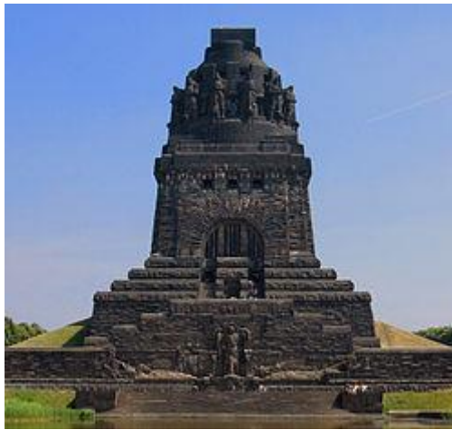
Het Völkerschlachtdenkmal te Leipzig

Het totaal aantal slachtoffers is onduidelijk. Men schat dat er 80.000–110.000 doden en gewonden vielen: de Fransen verloren 40.000 man en de geallieerden 55.000. Er werden ongeveer 30.000 Fransen gevangengenomen. Het gevecht dwong de Fransen definitief terug over de Rijn . Enkele Duitse staten werden ook heroverd op Napoleon.