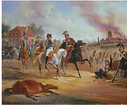
Napoleon en Poniatowski bij Leipzig, geschilderd door January Suchodolski

Napoleon opende de campagne door met 130.000 man op Blüchers leger van Silezië (95.000 man) op te marcheren. Tevens liet hij maarschalk Oudinot met het leger van Berlijn (70.000 man) tegen het leger van het Noorden (107.000 man) opmarcheren. Het leger van Bohemen (200.000 man) werd opgehouden door de passen van Bohemen af te sluiten. Conform de geallieerde strategie trok Blücher terug om zo te voorkomen slag te leveren met de hoofdmacht onder Napoleon. De legers van het Noorden en Bohemen rukten op. Oudinot raakte slaags met het Pruisische korps onder Bülow , ondersteund door de Russen van Wintzingerode van het leger van het Noorden bij Grossbeeren , maar leed een nederlaag.